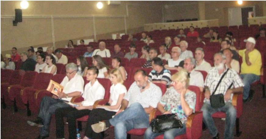
Гости за вријеме читања одлуке жирија о награђеним учесницима конкурса